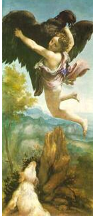
کورجیو / Corregio

هونەری ئەوروپی سەدە گانی ناوەراستی و پینسانس ۲۷۷